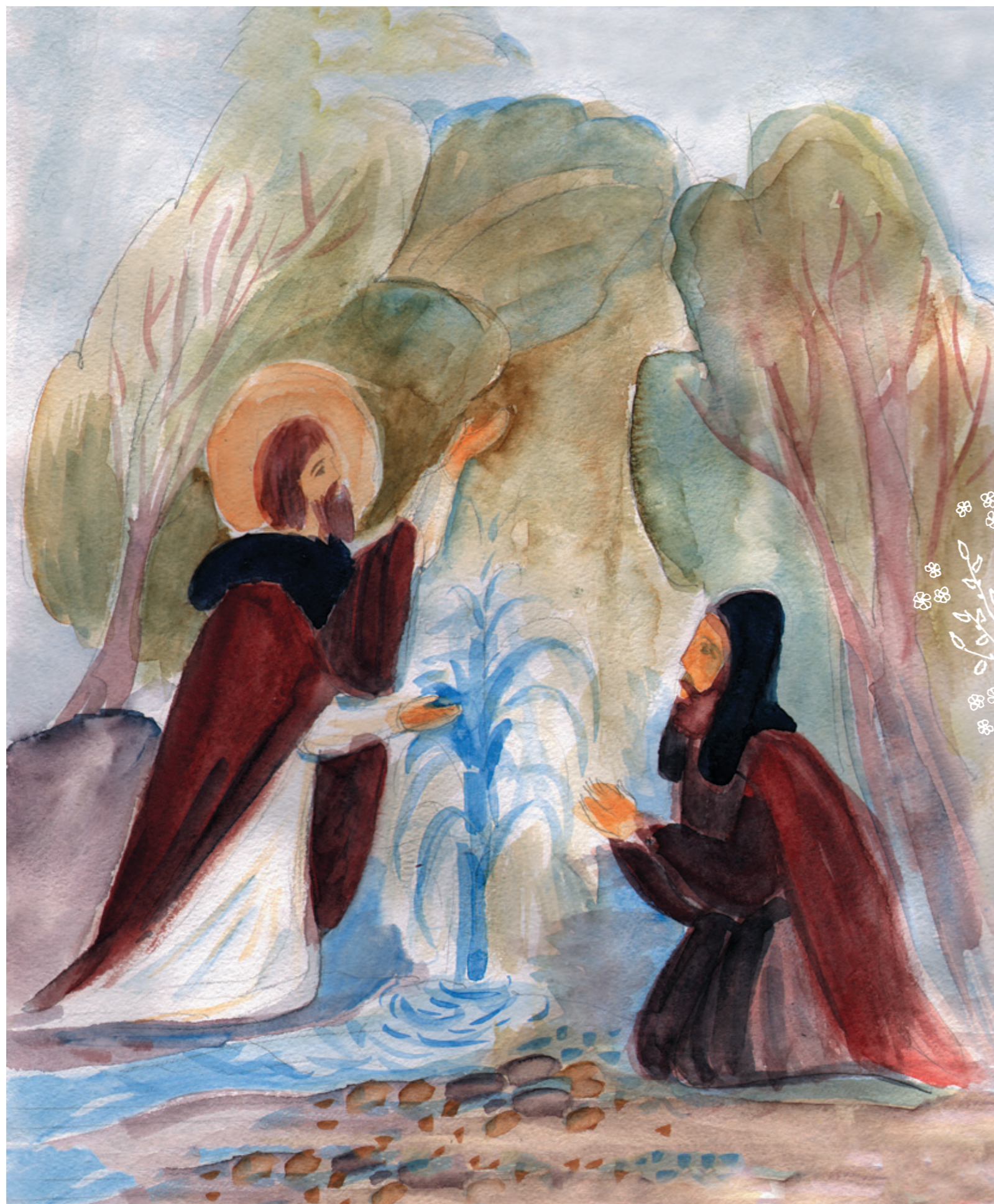
ГОСПОДИ, ДАРУЙ НАМ ВОДУ! Сопельняк Ксения, 13 лет