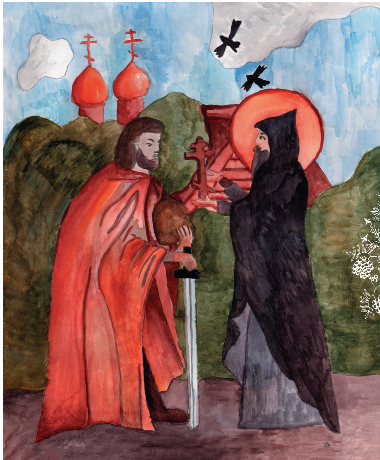
БЛАГОСЛОВЕНИЕ НА БИТВУ С ОРДОЙ Леонгард Татьяна, 13 лет