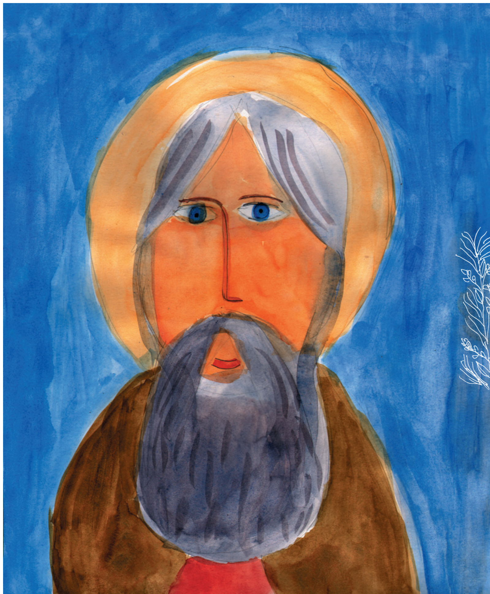
ПРЕПОДОБНЫЙ СЕРГИЙ РАДОНЕЖСКИЙ Сопельняк Арина, 8 лет