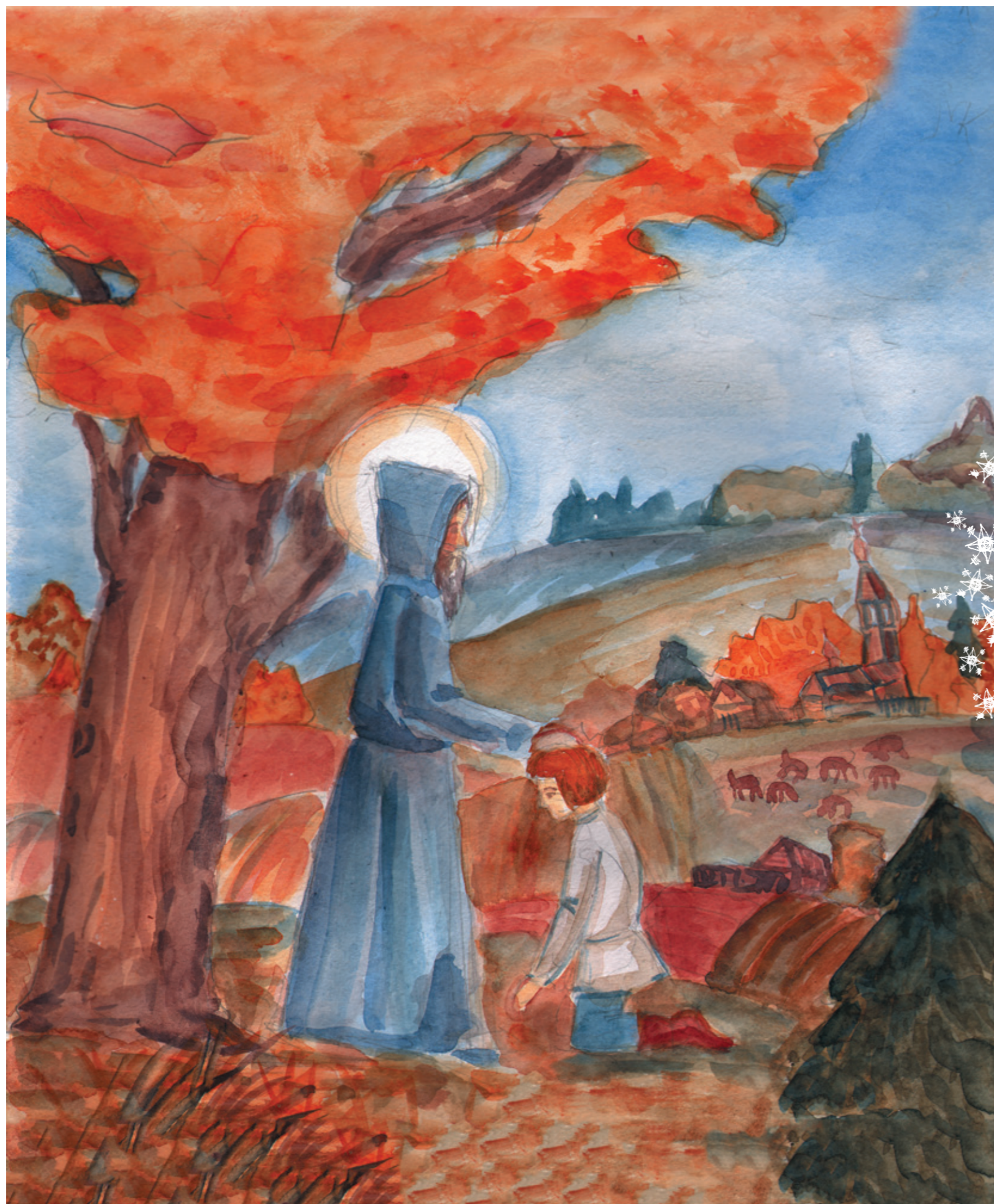
ТАИНСТВЕННЫЙ СТРАННИК Малыченко Кирилл, 15 лет