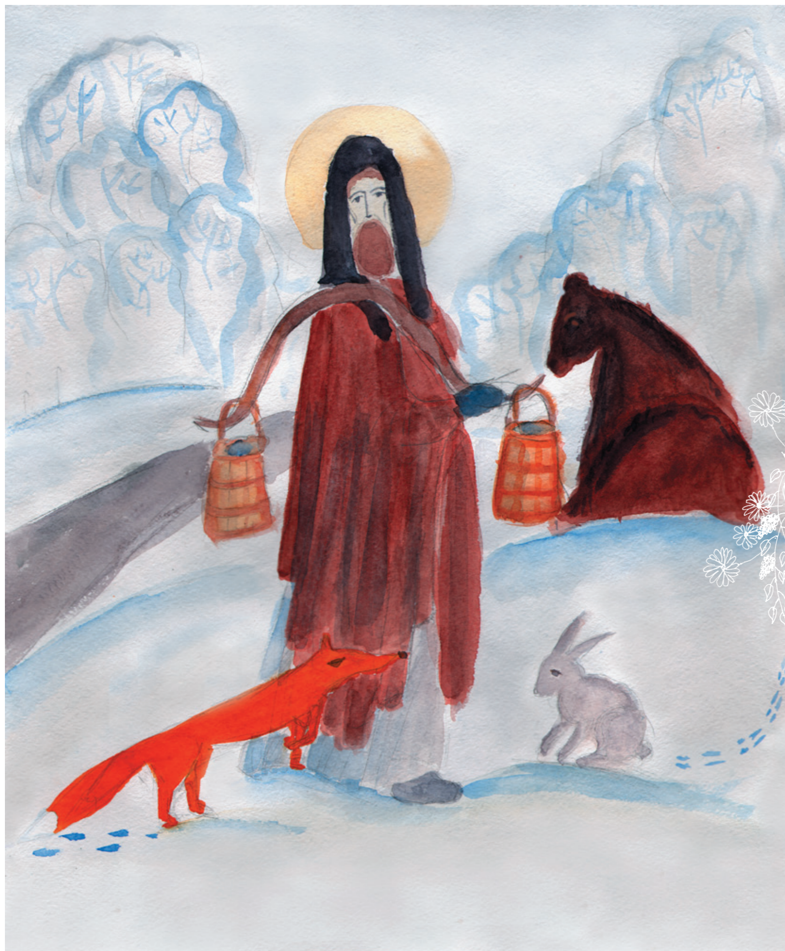
СМИРЕННЫЙ ИНОК Сопельняк Ксения, 13 лет